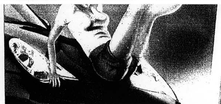
Erotik gibts nur in der Lack-Werbung: Mitarbeiter von Autop in der Waschstrasse